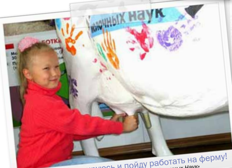
Немного потренируюсь и пойду работать на ферму! Уроки доения преподают в «Академии Молочных Наук»

«ЭкоНива-Вести» продолжает публиковать лучшие кадры в рамках проекта «В объективе — МЫ!». Приглашаем поучаствовать всех, кто считает, что яркие моменты из жизни села и людей, занимающихся крестьянским трудом, достойны того, чтобы остаться в истории.