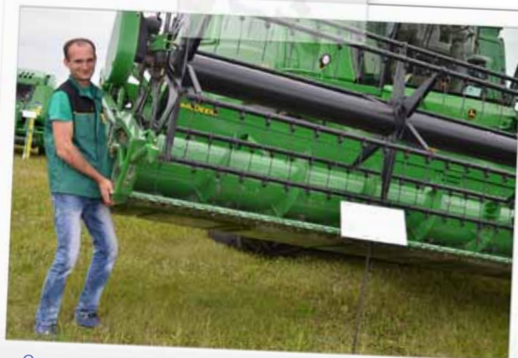
Сервисным инженерам «ЭкоНивы» все по плечу! На Дне поля в Тульской области

«ЭкоНива-Вести» продолжает публиковать лучшие кадры в рамках проекта «В объективе — МЫ!». Приглашаем поучаствовать всех, кто считает, что яркие моменты из жизни села и людей, занимающихся крестьянским трудом, достойны того, чтобы остаться в истории.