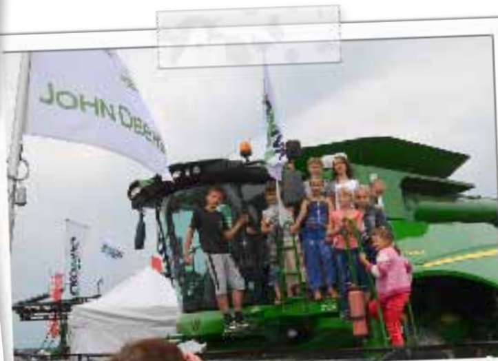
На такой технике согласны работать даже девчонки! Воронежские школьники на стенде «ЭкоНивы-Черноземье» на Дне поля — 2014