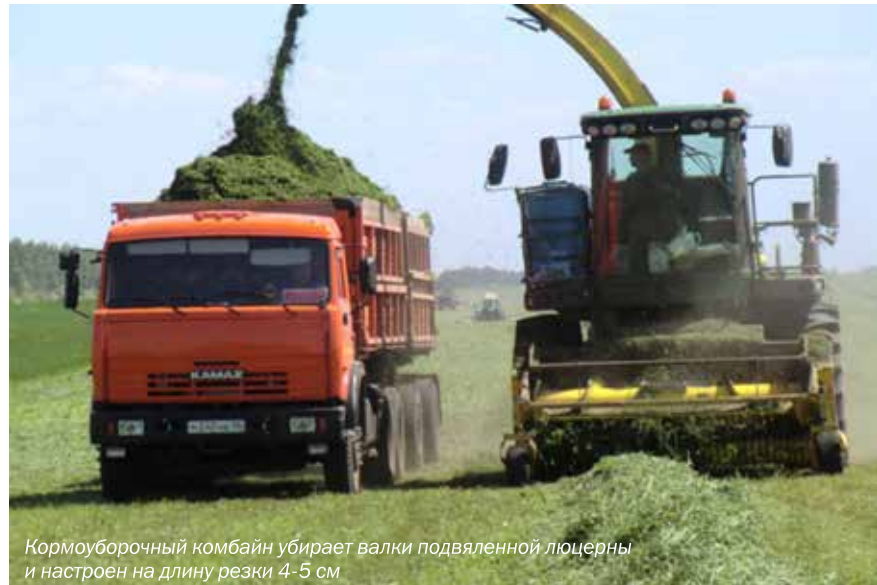
Кормоуборочный комбайн убирает валки подвяленной люцерны и настроен на длину резки 4-5 см

В рационе кормления грубыми кормами в условиях Сибири около 40% занимает сенаж из однолетних культур. По-прежнему лидирующие позиции по площадям здесь зани-