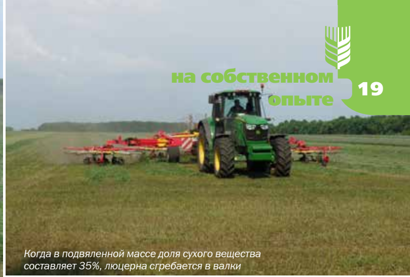
Когда в подвяленной массе доля сухого вещества составляет 35%, люцерна сгребается в валки

можно следующим образом: если при выкручивании пучка скошенной массы сок не проходит между пальцами, но ладони остаются влажными, мы достигли желаемого — 35% сухого вещества.