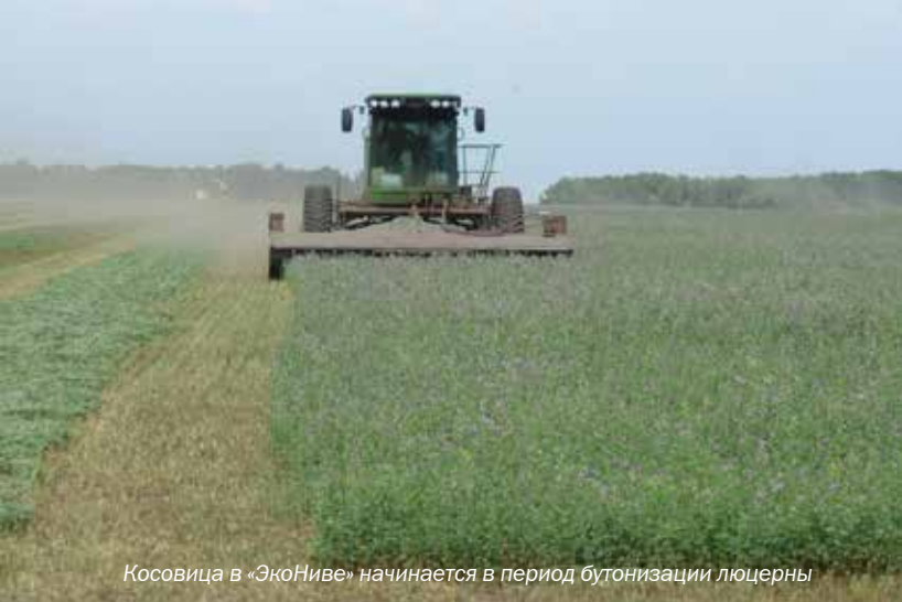
Косовица в «ЭкоНиве» начинается в период бутонизации люцерны